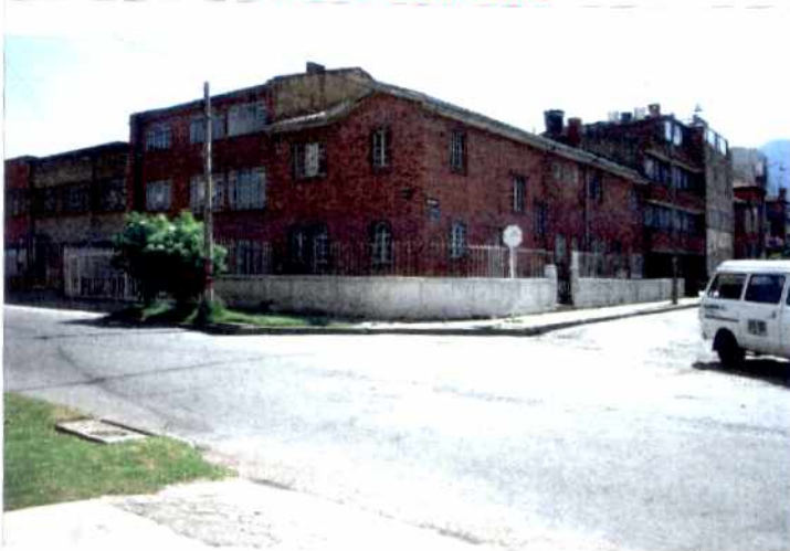
CRITERIOS DE CALIFICACION

✓ Representar en alguna medida y de modo tangible o visible una o mas épocas de la historia de la ciudad o una o mas etapas de la Arquitectura y/o urbanismo en el País.